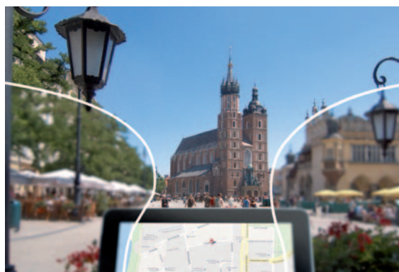
Lente progressiva tradizionale

L'ingresso nel mondo della progressione interna SEIKO