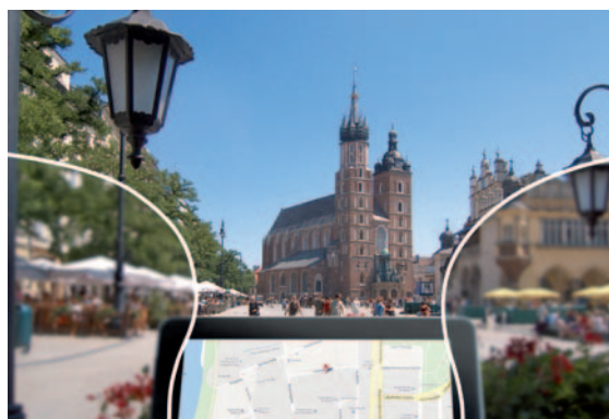
SEIKO VISION X con progressione interna

I vantaggi della progressione interna sono evidenti. L'“effetto restringimento” è notevolmente ridotto in tutte le aree. La zona da vicino, che è la più lontana dall'occhio, è la parte che ne beneficia maggiormente. Distorsioni e astigmatismi residui notevolmente ridotti con SEIKO VISION X.